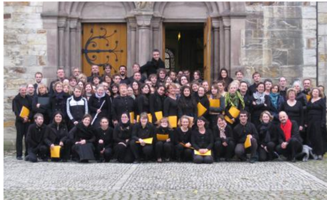
Messe en Ut Majeur / Beethoven - Paderborn Allemagne - Chœur & Orchestre - novembre 2009

2012 - 1982 : 30 e anniversaire de la refondation du Chœur Universitaire de Caen 2012 - 1992 : 20 e anniversaire de la refondation de l'Orchestre Universitaire de Caen