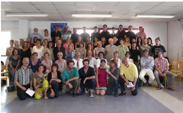
L'équipe d'encadrement, les chefs de chœurs, les responsables danse, les comédiens et les partenaires du projet réunis le 1 er juillet dernier au C.O.U.R.