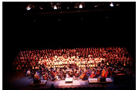
Carmina Burana version concert | 28 mai 2008 Zénith de Caen