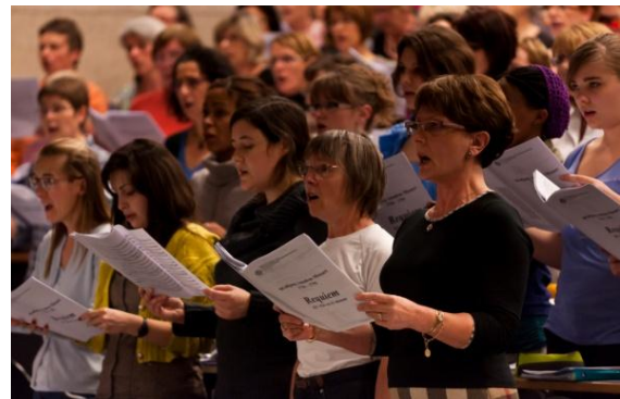
Répétition du chœur Wolfgang A. le 26 novembre dernier.