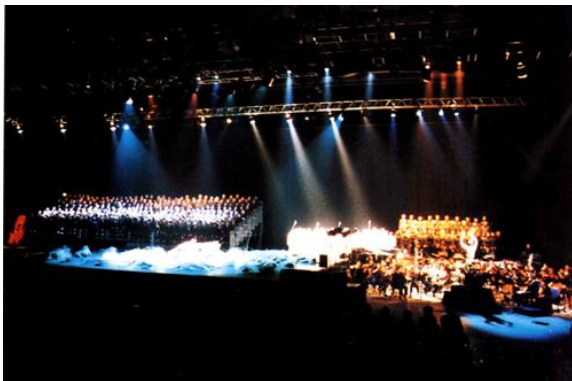
Carmina Burana version scénique originale | 6, 8 avril 1997 Zénith de Caen | Photo S. Guichard

des comédiennes et comédiens professionnels et amateurs, des danseuses et danseurs de la M.J.C. d'Hérouville-Saint-Clair, La Butte-Caen, de l'école de danse de Grainville-sur-Odon, du S.U.A.P.S., des échassiers, jongleurs et grimpeurs, des choristes issus des chœurs d'école, de collèges, de lycées de l'Académie de Caen, de chœurs de Basse-Normandie, de la chorale universitaire et de l'U.I.A. de Caen, des instrumentistes de l'orchestre universitaire, des solistes instrumentaux et vocaux issus du Conservatoire et des Écoles de Musique de notre région.